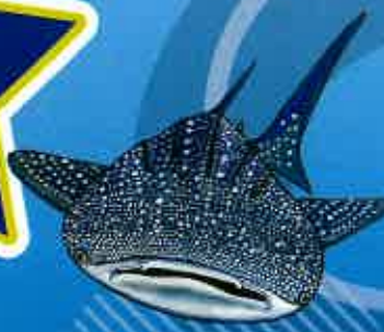
ジンハエサメちゃん