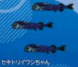
セキトリイワシちゃん