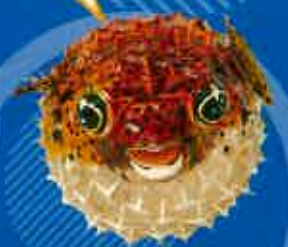
ハリセンボンちゃん