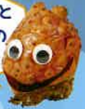
マダガスカちゃん