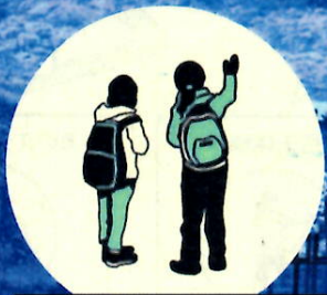
五感で感じる自然観察 (ネイチャーガイド)