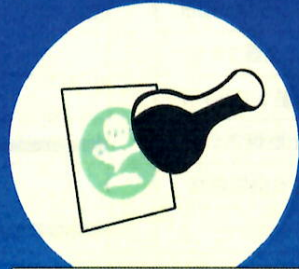
海のスタンプラリー