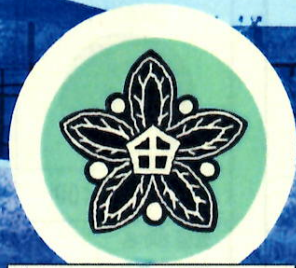
たはランディア 特設コーナー