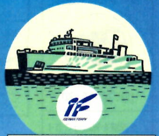
伊勢湾フェリー 特設コーナー