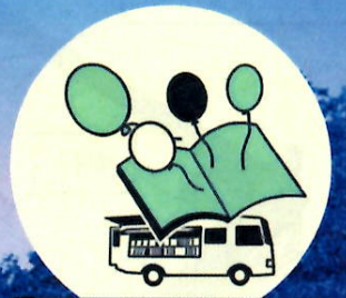
移動図書館 特設コーナー (中央図書館)