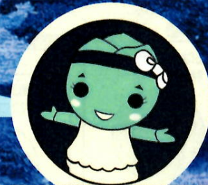
サンテパルク 出張工作