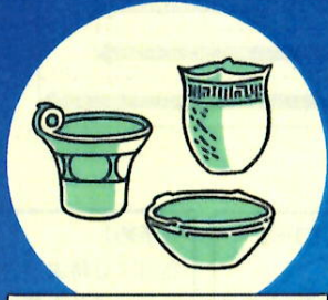
セルフでミニ土器づくり