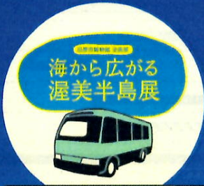
博物館シャトルバス運行