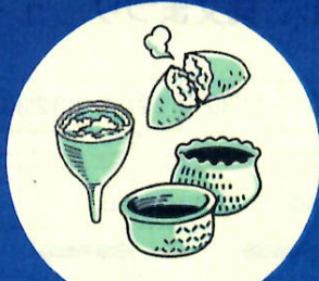
たき火 土器焼き・塩づくりデモ